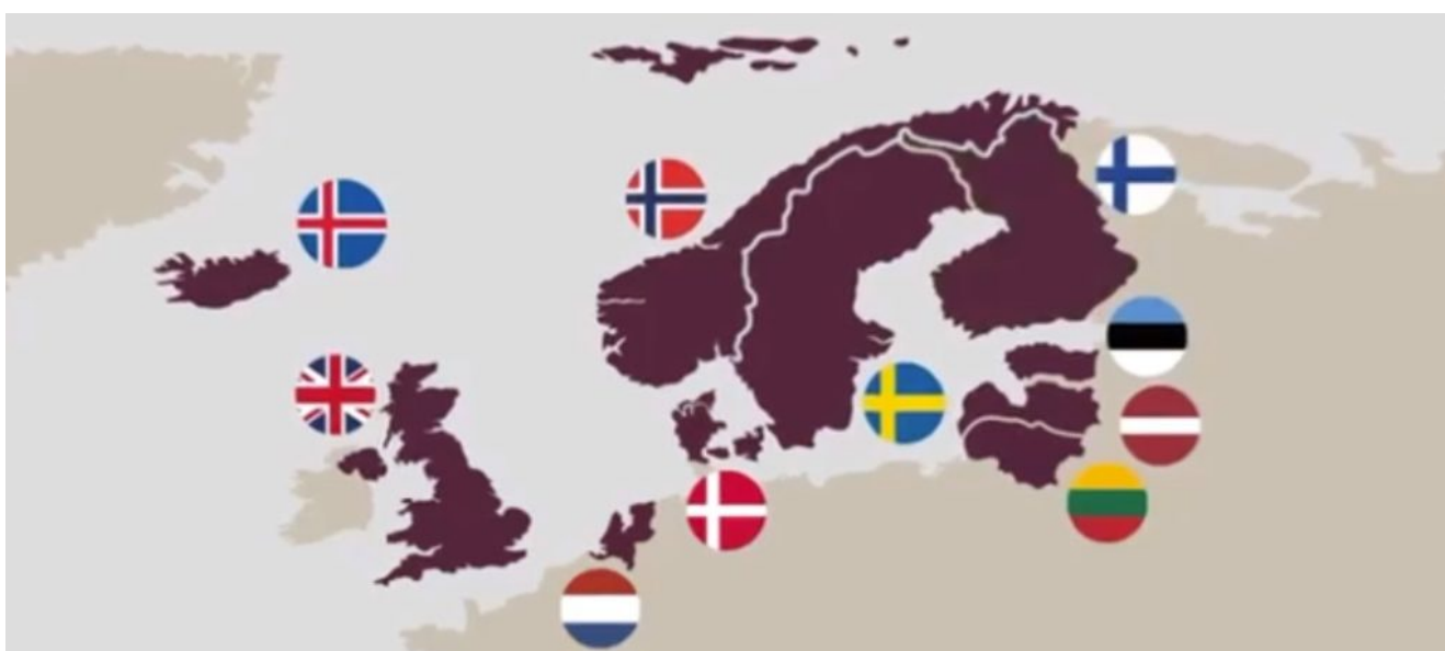
Imagen: Estados miembros de la JEF.

El imperialismo británico se encuentra entre las principales potencias militares del mundo. Entre las potencias europeas occidentales, sólo Francia está a la altura del Reino Unido. Fueron el mayor contribuyente a la guerra de Afganistán después de Estados Unidos, y durante mucho tiempo fueron los aliados más cercanos de Estados Unidos en numerosas ocasiones.