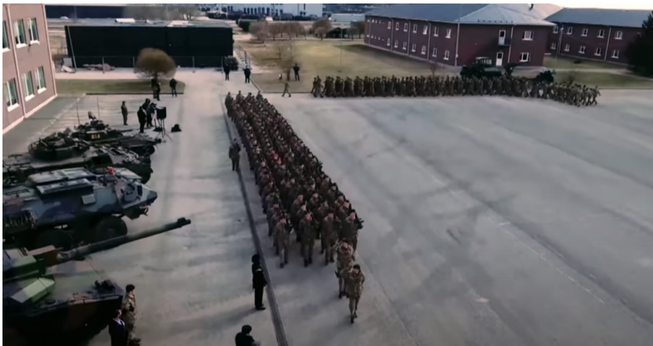
Imagen: De la película de las Fuerzas sobre el ejercicio de la OTAN Cold Response en 2022.

no está bajo el mando de un país de la UE, y en ella participan también Noruega e Islandia, que no son miembros de la UE. Así, varios países de la UE se incorporan a una fuerza bajo mando británico. Además, incluye a Suecia y Finlandia, que no son miembros de la OTAN, bajo el mando del Reino Unido, miembro de la OTAN.